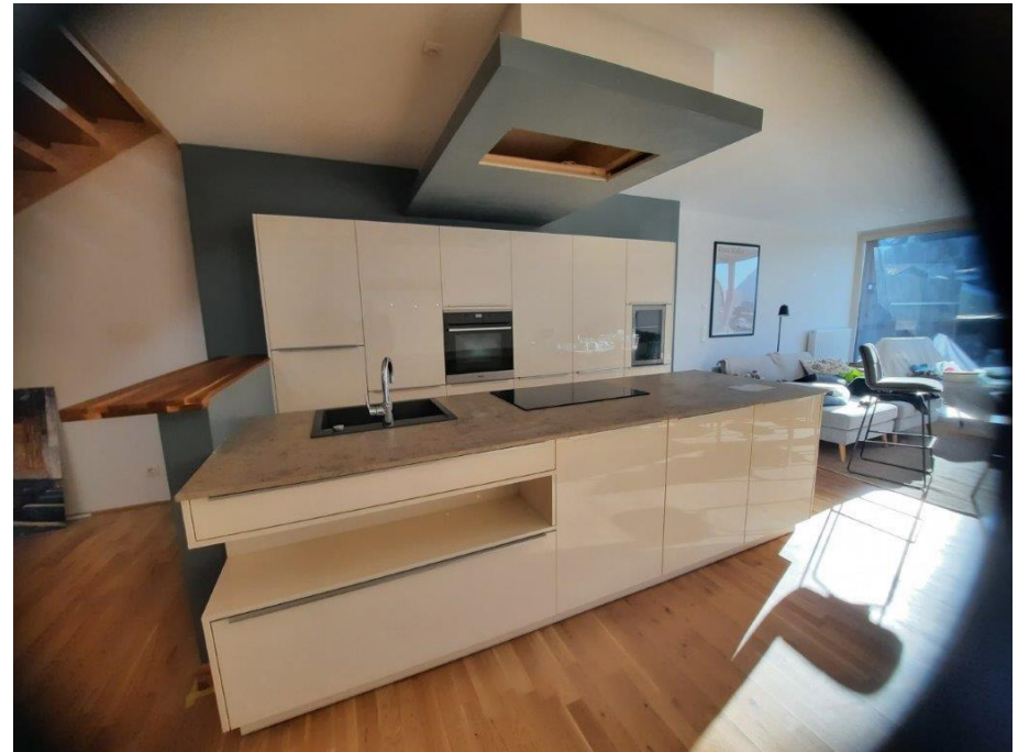
Unterer Stadtplatz 11, Top 3.6 6330 Kufstein